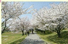
②桜のトンネル (3月下旬~4月初旬)