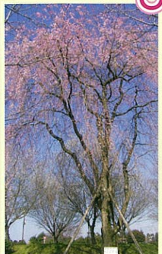
①しだれ桜 (3月下旬~4月初旬)